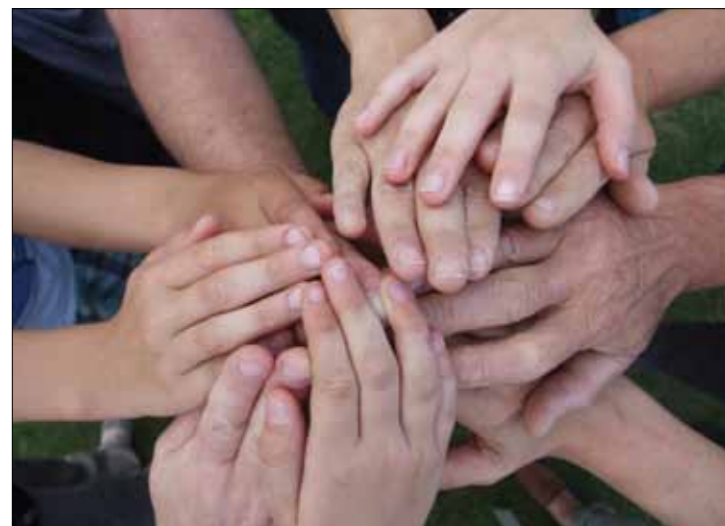
Eltern mit Wirkung