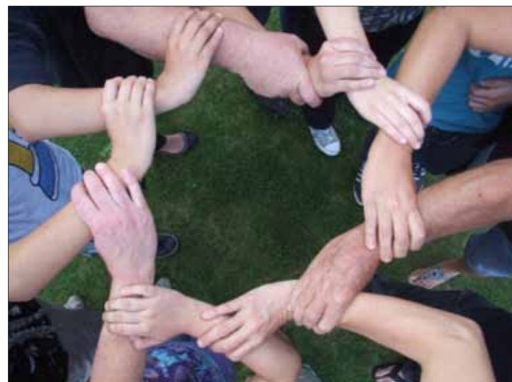
Eltern mit Wirkung

Klar geregelt ist, welche Bereiche von einer Mitwirkung ausgeschlossen sind. So können