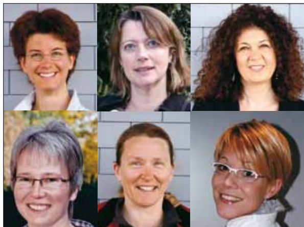
Vorstand ElternMitWirkung Schule Schlimperg