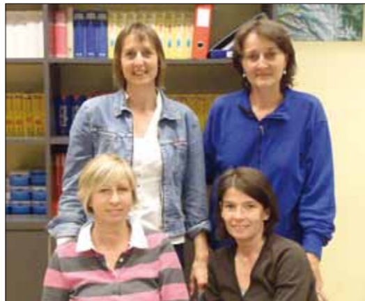
Kerngruppe Elternrat Hagen/Watt

Der Elternrat Hagen/Watt setzt sich aus Eltern zusammen, deren Kinder in Illnau oder in Effretikon die Oberstufe besuchen. Wir sind in zwei Gremien organisiert: Für die Koordination, Planung und Projektklärung ist die Kerngruppe verantwortlich. Sie trifft sich mit einem/einer Lehrvertreter nach Absprache ca. 5 x im Jahr. Mitglieder des Springerteams konzentrieren sich auf ein freigeschaltetes Projekt bzw. eine freigelegte Aufgabe.