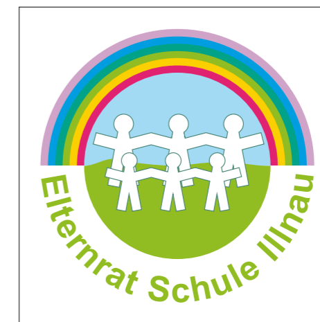
Logo Elternrat Schule Illnau

Wir treffen uns rund drei Mal pro Schuljahr und besprechen aktuelle Anliegen der Eltern, diskutieren über durchgeführte Projekte und definieren die nächsten Vertiefungsthemen des Elternrats. Der Vorstand, der sich vier bis sechs Mal jährlich trifft, besteht aus fünf Mitgliedern sowie einem Beisitz, der vom Elternverein Illnau gestellt wird. Damit ist sichergestellt, dass Elternrat und Elternverein nicht an den gleichen Aufgaben arbeiten und dass gegenseitig vom bestehenden Know-how pro-