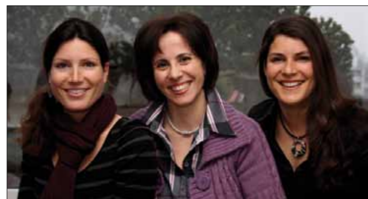
Vorstand Elternrat Schule Eselriet

die Eltern zum Thema „Sicherheit im Umgang mit Handy und Internet“ Achtung Liebe: Erste Durchführung des Sexualkundeunterrichts für die 6. Klasse, welcher nun als jährlich wiederkehrender Schulmorgen organisiert wird