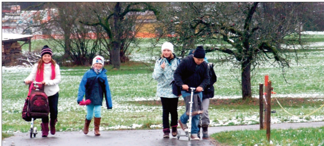
Der Schulweg hat verschiedene Funktionen

«Gäll du haltisch für mich aa?», fragt eine Erstklässlerin vom Plakat aus die Automobilisten. Gleich daneben bringt die Lotsin in der orangen Signalweste die Autos zum Anhalten, damit die Kinder sicher den Zebrastreifen passieren können. Ein mittlerweile gewohntes Bild in unserer Stadt und Zeichen, dass viel für die Sicherheit der Schulwege getan wird.