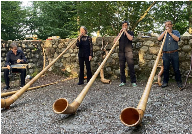
Moosburgkonzert 2022 Effretikon