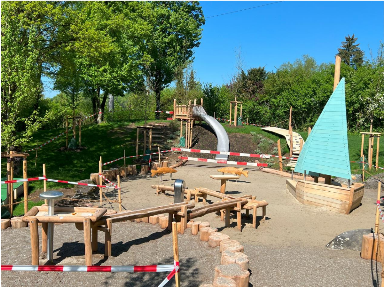
Neue Holzspielgeräte sorgen für Spiel und Spass. Im Zentrum das neue Piratenschiff.