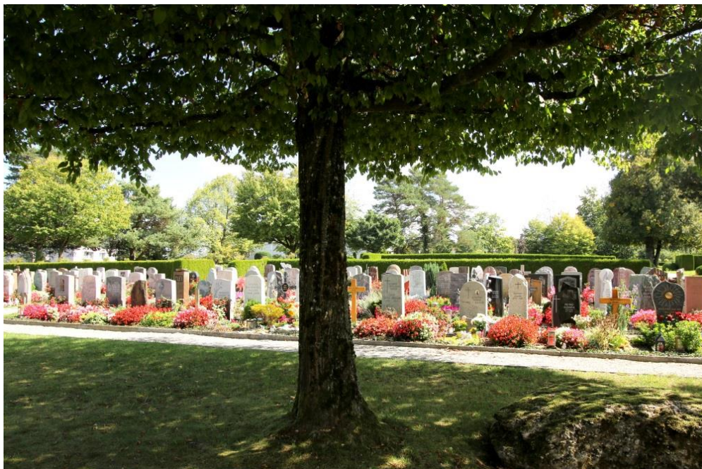
Friedhof Zegli, Effretikon