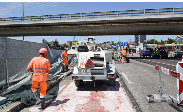
Oben: Einschwenken eines Signalportals. Unten: Instandsetzung der Überführung Neugutstrasse in Wallisellen.

Zwischen der Verzweigung Zürich-Ost und dem Anschluss Effretikon werden bis voraussichtlich Sommer 2021 umfangreiche Instandsetzungsarbeiten und Massnahmen zur Verkehrsoptimierung umgesetzt. Nach der Hälfte des Projekts kann ein positives Zwischenfazit gezogen werden. Die Arbeiten haben sogar einen leichten Vorsprung auf den Fahrplan.