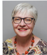
R. Quadranti Mitte